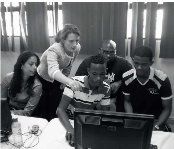
Foto 2: UN-SPIDER Trainerin während einer Fernerkundungsfortbildung in der Dominikanischen Republik im Mai 2013

Obwohl der Nutzen von Satellitendaten deutlich erkennbar ist, verwenden sie viele Entwicklungsländer nicht. Die Gründe reichen von einem fehlenden Wissen über ihre Anwendung, bis zu fehlenden Geldern oder Fachpersonal. Diese Lücke will UN-SPIDER schließen.