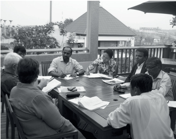
Foto 1: Das Expertenteam diskutiert während der UN-SPIDER Technischen Beratungsmission nach Myanmar im März 2012