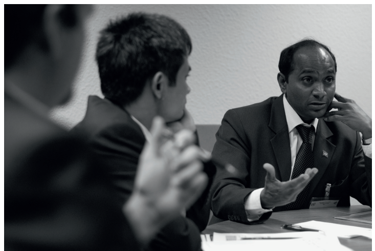
Foto 4: Diskussion während einer internationalen UN-SPIDER Konferenz zum Thema Satellitendaten für das Katastrophenmanagement

Über das Wissensportal bietet das Programm eine zentrale Anlaufstelle für Informationen über die