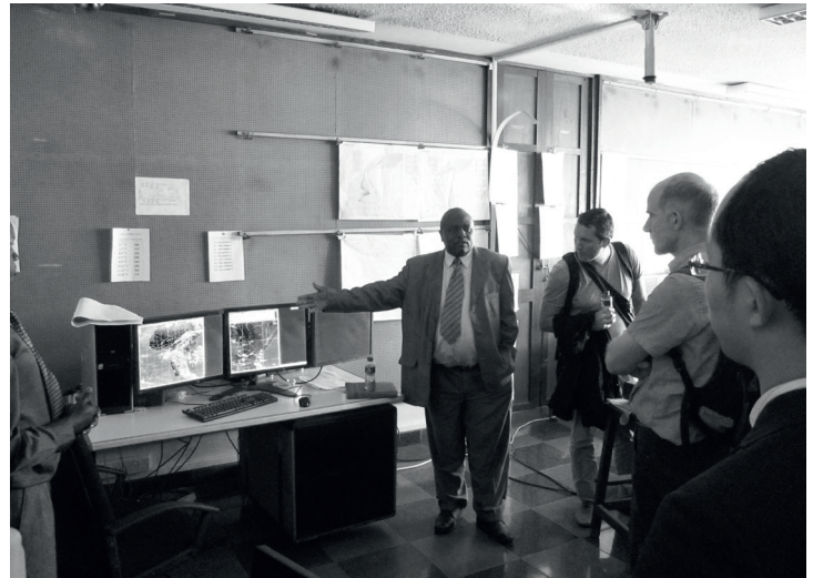
Foto 3: Vorführung während einer Technischen Beratungsmission in Kenia im Februar 2014

Damit Mitgliedsstaaten ihre eigenen Fähigkeiten zur Erstellung von Fernerkundungsprodukten verbessern können, führt UN-SPIDER in der Folge seiner Beratungsmissionen oft technische Trainingskurse im Bereich GIS und Fernerkundung für die Mitarbeiter in den relevanten Institutionen durch. So organisierte UN-SPIDER beispielsweise im Juni 2014 ein Trainingsprogramm zum Thema “Multi-Level Risk Profiling” in Kathmandu, Nepal, an dem 20 Teilnehmer aus Ländern der Region teilnahmen. Im Mai 2013 führten zwei UN-SPIDER Experten gemeinsam mit Partnern aus Panama und Kolumbien eine Fortbildung zum Thema Fernerkundung bei Überschwemmungen mit Hilfe von optischen Satellitendaten für die inter-institutionelle Arbeitsgruppe in der Dominikanischen Republik durch. Es nahmen knapp 30 Mitarbeiter aus 15 staatlichen Stellen, Ministerien und Universitäten teil. Insgesamt unterstützt UN-SPIDER jedes Jahr ungefähr 30 Länder durch technische Beratung, zuletzt beispielsweise in Bhutan, Sambia, El Salvador und Kenia.