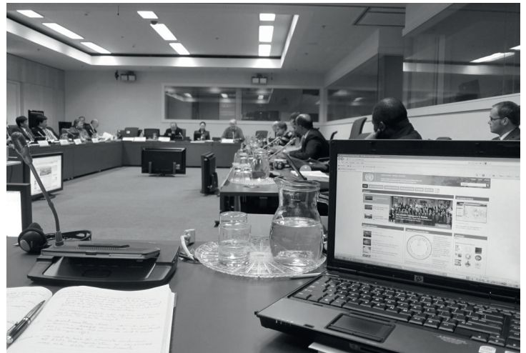
Foto 7: Treffen der regionalen Unterstützungsbüros in Wien im Februar 2012 bei einer Diskussion zum UN-SPIDER Wissensportal

Im März 2015 kamen Vertreter der UN-Mitgliedsstaaten in Sendai, Japan zusammen und einigten sich auf ein neues internationales Regelwerk für die internationale Katastrophenvorsorge. UN-SPIDERs Ziel, Satellitendaten hierin als festes Element zu verankern, wurde erfüllt: An mehreren Stellen betont das Abkommen die Wichtigkeit von Satellitendaten, da sie wertvolle Informationen für eine langfristig angelegte Katastrophenvorsorge bieten. Bereits im Ergebnisdokument der letzten großen Konferenz zu nachhaltiger Entwicklung in Rio de Janeiro 2012 werden Satellitendaten explizit erwähnt 1 ( United Nations General Assembly 2012). UN-SPIDER und