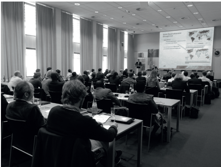
Foto 5: Teilnehmer des UN-SPIDER Bonn Expertentreffens zum Thema Satellitendaten für Dürre und Überschwemmungs-Risikominimierung im Juni 2014

Anwendung von Satellitendaten für das Katastrophenmanagement. Von Praxisbeispielen aus allen Ländern über wissenschaftliche Studien und Links zu frei verfügbaren Ressourcen bis hin zu Kontaktdatenbanken und einem Fortbildungskalender bietet das Portal Informationen in verschiedenem Detailgrad, je nach Anwendungssituation, Informationsbedarf oder Hintergrundwissen des Nutzers. Eines der Hauptelemente des Webportals ist die „Space Application Matrix“. Es handelt sich um eine Suchmaschine mit Filteroptionen nach Katastrophenarten, Katastrophenphase und Satellitentechnologie (Erdbbeobachtung, Navigation und Kommunikation), mit der über 200 Fallstudien zugänglich sind. Ein anderes Kernelement der Seite ist die „Links and Resources“-Rubrik, die Datenban-