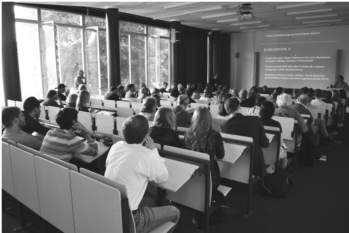
Rund einhundert Interessierte erschienen zur Podiumsdiskussion. Nach den kurzen Vorträgen und Statements der Redner gab es jeweils die Gelegenheit, sich mit Fragen und Stellungnahmen an der Diskussion zu beteiligen. Sowohl Kolleg/innen aus der Geographie als auch Bewohner/innen Gostenhofs nutzten diese Möglichkeit.