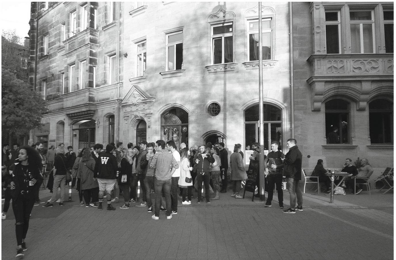
Am Petra-Kelly-Platz (2017)